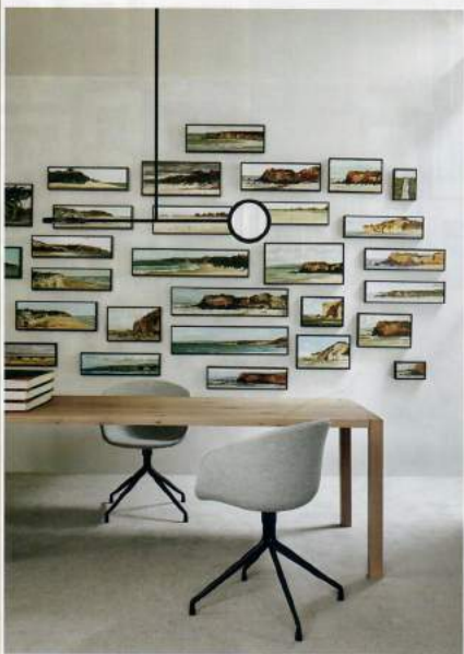
Casio Garkowada / Lisa Cohen