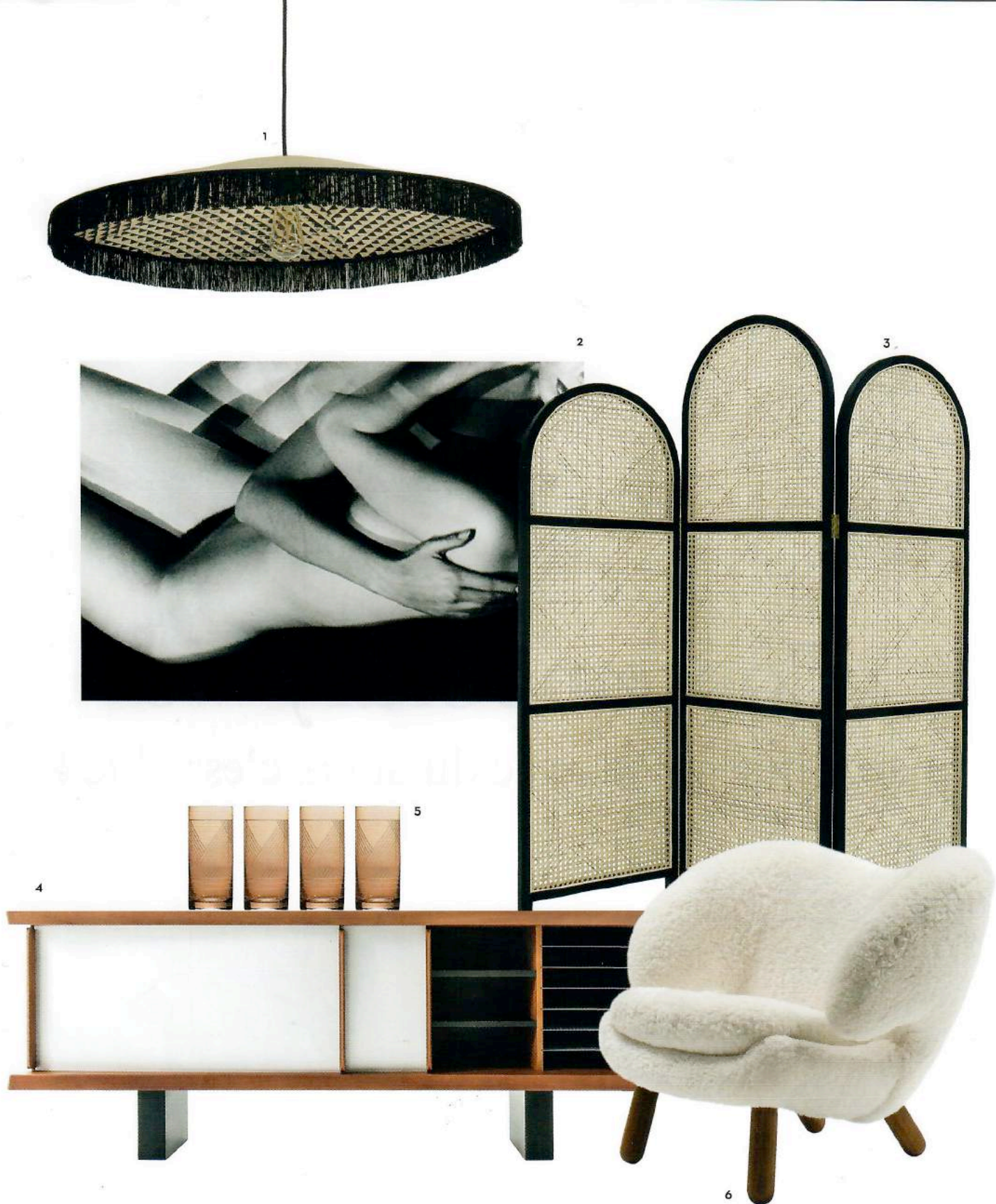
Page de gauche Tapis Losanges II (230 x 300 cm) en laine afghane, design Erwan et Ronan Bouroullec, 6552 €. Nanimarquina. Fauteuil LCW Plywood Group , des Eames (Vitra). 1/ Suspension Pamela P . Selon le diamètre, 25 cm : 125 € ; 50 cm : 225 € ; 80 cm : 325 €. Le Monde sauvage. 2/ Photographie Couple de femmes dans un miroir (1974), de Claude Guillaumin. Impression jet d'encre sur papier d'art. Œuvre signée et numérotée, limitée à 9 exemplaires, vendue non encadrée (40 x 60 cm), avec certificat d'authenticité, 1650 €. Artsper. 3/ Paravent en cannage (180 x 2,5 x 150 cm), 545 €. Home Autour du Monde. 4/ Meuble de rangement 513 Riflesso en bois, finitions acajou et portes en aluminium anodisé, design Charlotte Perriand, 6563 €. Cassina. 5/ Verres à soda à motif géométrique, 999 € pièce. Zara Home. 6/ Fauteuil Pelican (1940), design Finn Juhl, 6915 €. House of Finn Juhl à la galerie Triode.