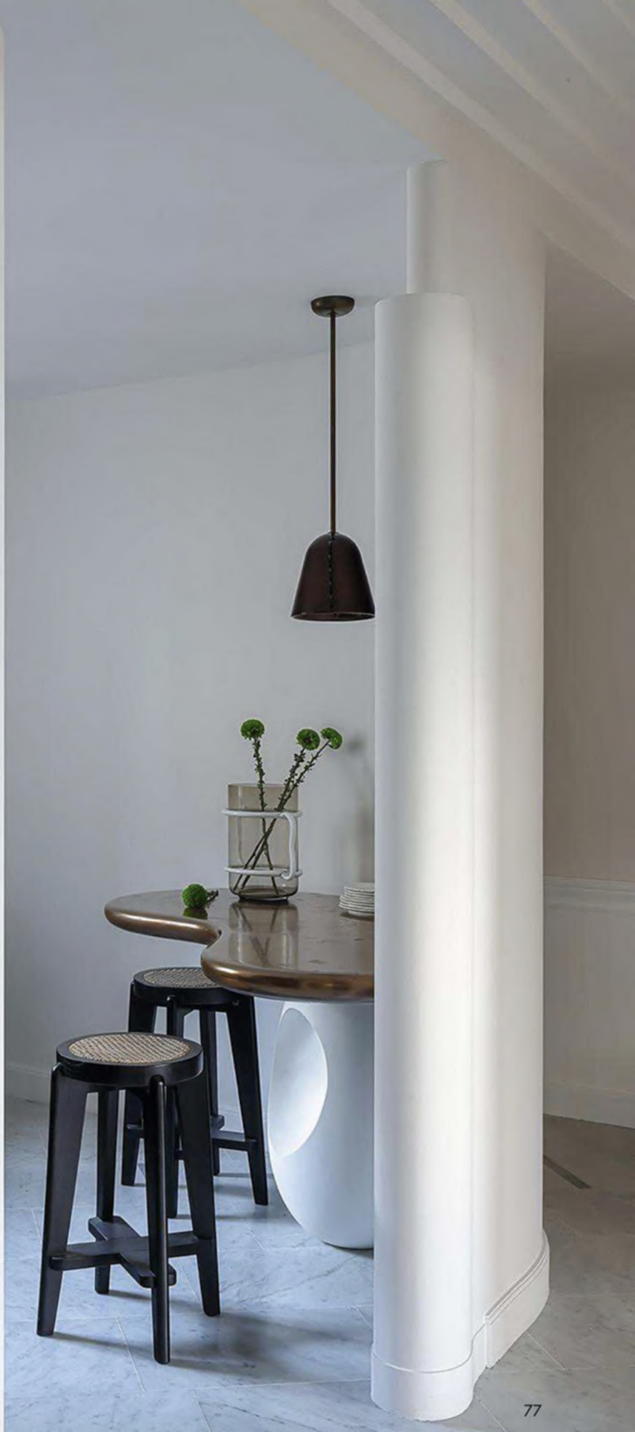
Table haute avec une métallisation à froid sur le plateau, Le Berre Vevaud, vase, «Liana», en verre de Bohême et opaline, Éric Schmitt, suspension, de Sophie Lou Jacobsen pour In Common With, Triode, applique «Eguski», en plâtre, Le Berre Vevaud et assiettes, Serax.