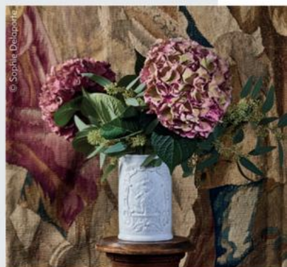
Astier de Villatte, Messenger