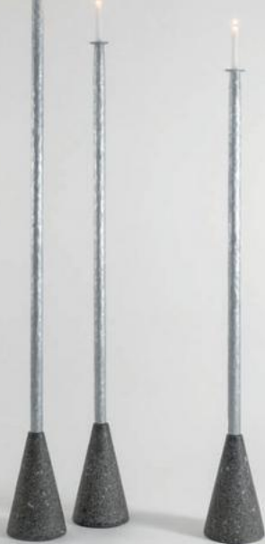
Galerie Kreo Candelebra Triple Design Ronan Bouroullec