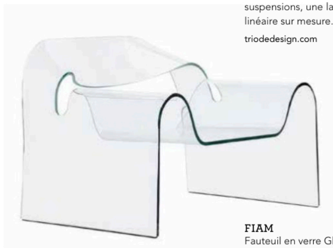
FIAM Fauteuil en verre Ghost