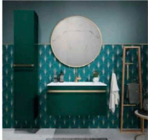
Meuble vasque loo, 379 €, Leroy Merlin

Papier peint Palmettes, 22,90 €, Leroy Merlin