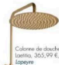
Colonne de douche Laetitia, 365,99 €, Lapeyre

Lustre Moonrise Chandelier 02, prix sur demande, Roll & Hill chez Triode