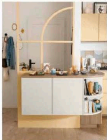
Cuisine Cosmic, 3 654 €, SoCoo'c