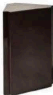
Les tables d'appoint Podium. Podium side tables.

Founded in 2012 by French film set designer Gabriel Abraham, Atelier de Troupe is imbued with his scenographic vision. Conceived like screenplays, his collections seem to interact in space, through blown glass, brass, lacquer and precious woods. Atelier de Troupe creates a dialogue between delicate materials and pure lines, modernist influences and Art Deco, with each piece meticulously crafted to order by exceptional artisans. Atelier de Troupe presented the Intermezzo exhibition in Milan this year and then in New York with the duo behind Studioutte. A new collection will be presented at the Matter & Shape fair in March and at Galerie Triode in Paris. In 2026, the studio will be rebranded as De Troupe. M.F.