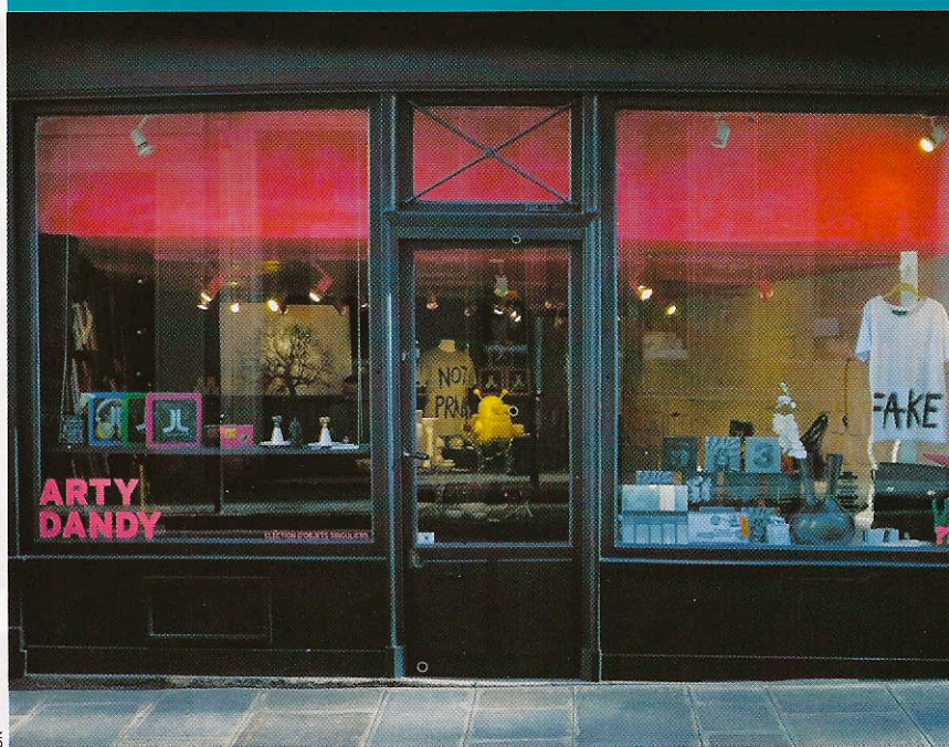
Arty Dandy mêle pièces de jeunes artistes et petits objets déco.