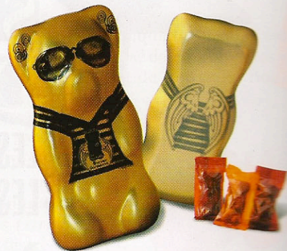
Une boîte Ourson collector chez Arty Dandy.